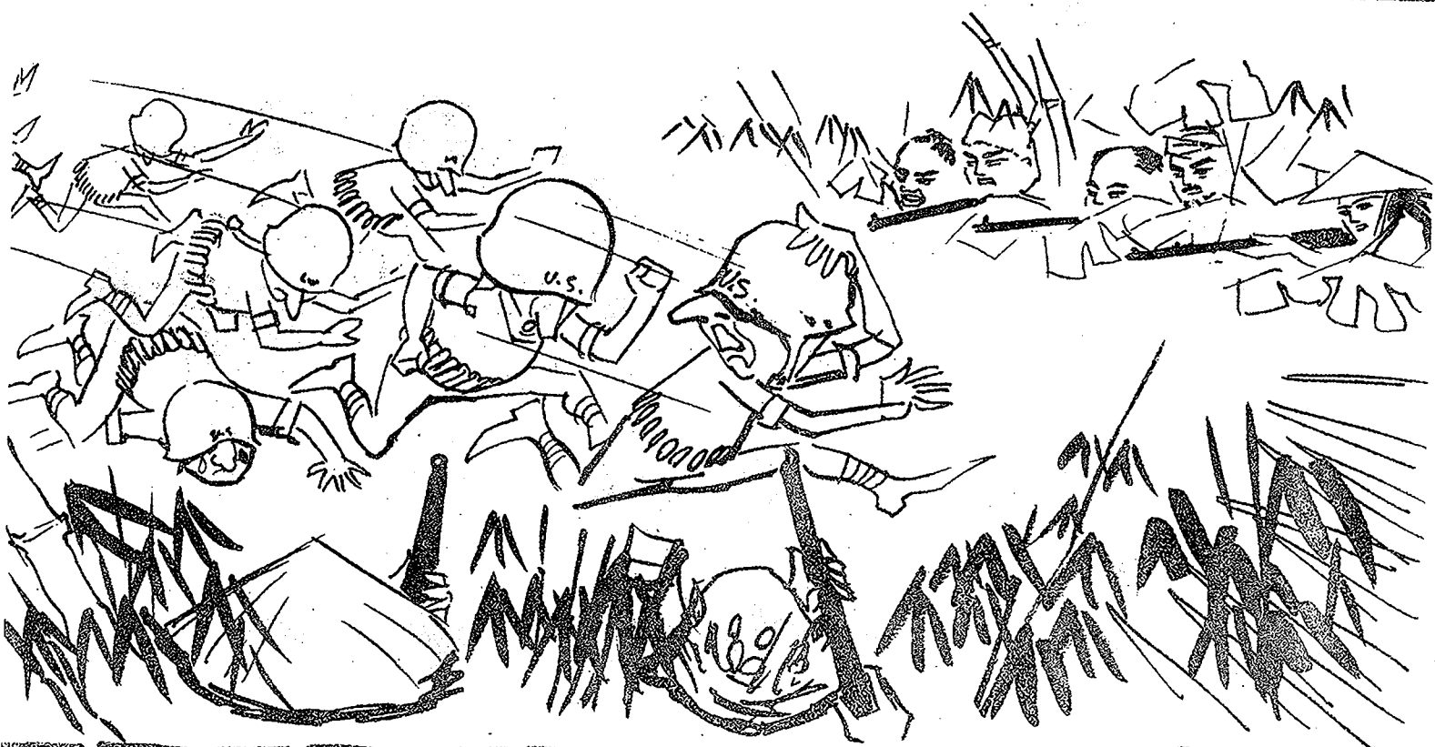
5 投入神網，奔向叢林，嗚呼，US！